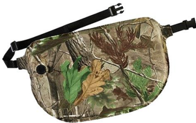
Selvoppusteligt sæde - vandtæt