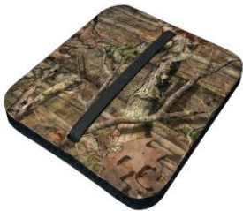
Siddepude – vandtæt og med tyk polstring