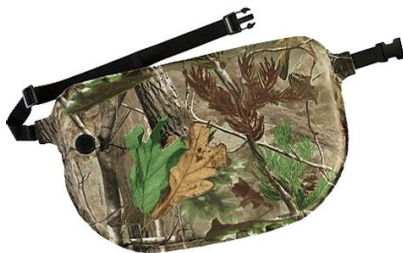
Selvoppusteligt sæde - vandtæt