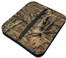
Siddepude – vandtæt og med tyk polstring